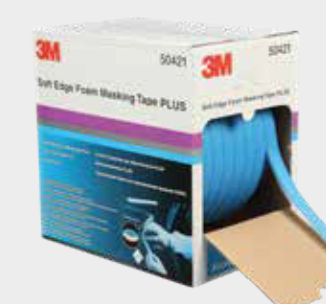
3M™ Soft Edge Foam Masking Tape PLUS