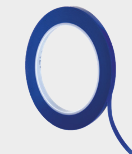
3M™ Fin linjemaskeringstejp 471+