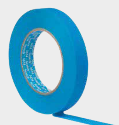
3M™ Scotch® Maskeringstejp 3M 3434