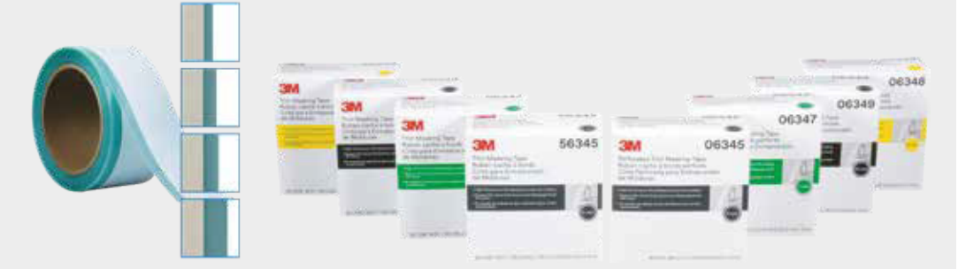
3M™ Trim Masking Tape