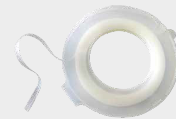
3M™ Smooth Transition Tape

Obs! Undvik att skapa hårda färgkanter vid maskering av primer. Detta får ytan att svälla på grund av koncentrationen av lösningsmedel vid tejpkanterna.