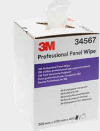
3M™ professionella torkdukar