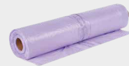
3M™ Purple Premium PLUS Clear Masking Film 4 m x 150 m, 5 m x 120 m, 6 m x 120 m