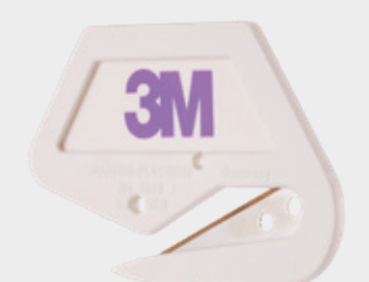
3M™ Premium skärverktyg